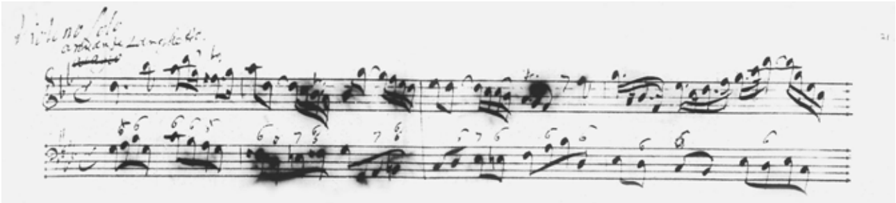
Die erste Zeile des Autographs The first line of the autograph

Übersetzung: Günter und Leonore von Zadow